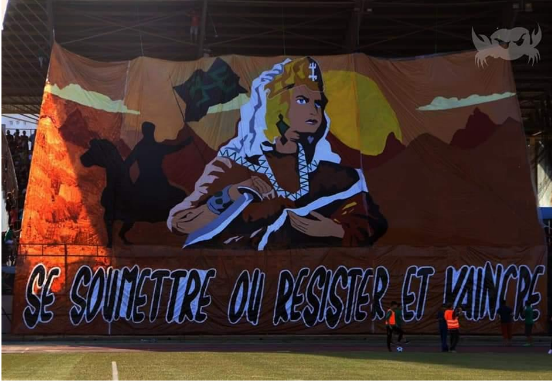
العينة رقم 03