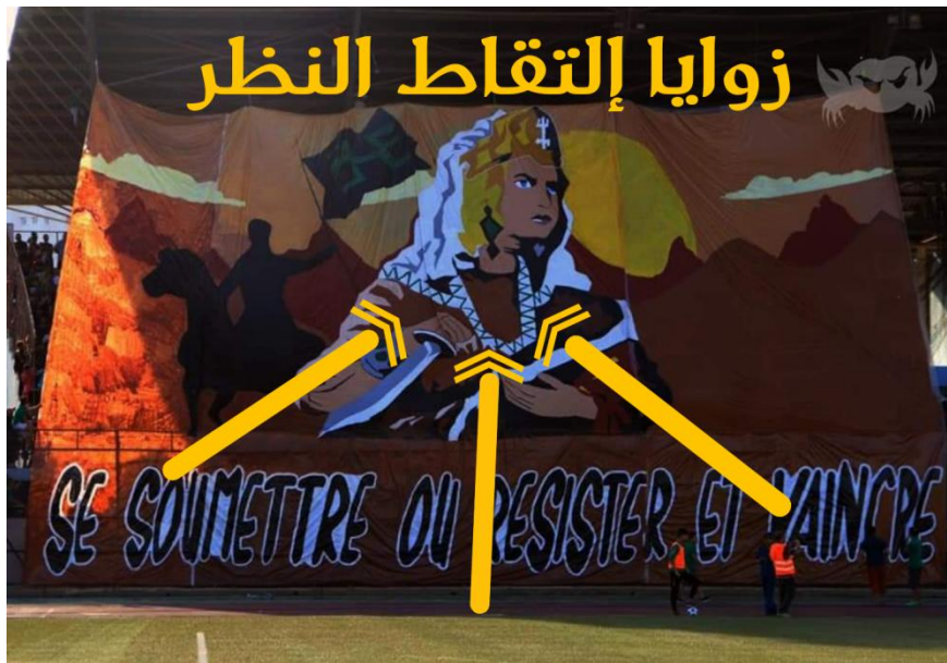
الشكل يمثل زوايا التقاط الصورة

زوايا التقاط النظر والهدف منها : يتضح لما من خلال مشاهدة هذا التيفو انه يبدو مقابلا وان عين المتلقي تتجه مباشرة الى المرأة التي تحمل سيفها في يدها