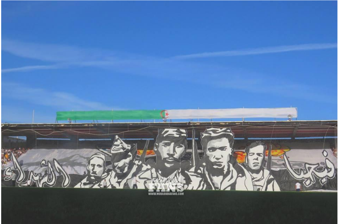
العينة رقم 02