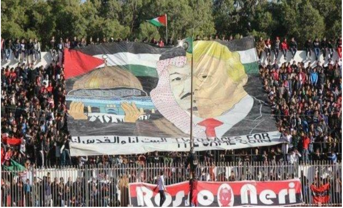
العينة رقم 01