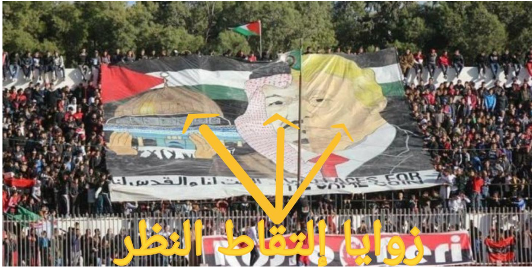
الشكل يمثل زوايا التقاط الصورة

زوايا التقاط النظر و الهدف منها : زاوية التصور أمامية والصورة تبدو مقابلة والمشاهد يلاحظ كل شئ من الوهلة الاولى .