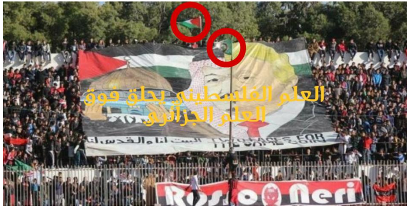
شكل يوضح لنا العلم الفلسطيني يحلق فوق العلم الجزائري

كما نلاحظ أيضا في أعلى الصورة الراية الفلسطينية تعلق عاليا في سماء الملعب بحيث كانت هذه الراية في مستوى الصورة فوق العلم الجزائري كل هذا في ملعب جزائري وهذه دلالة قوية مدى تعلق الجماهير هنا بالعلم والقضية الفلسطينية كما هو موضح في الشكل :